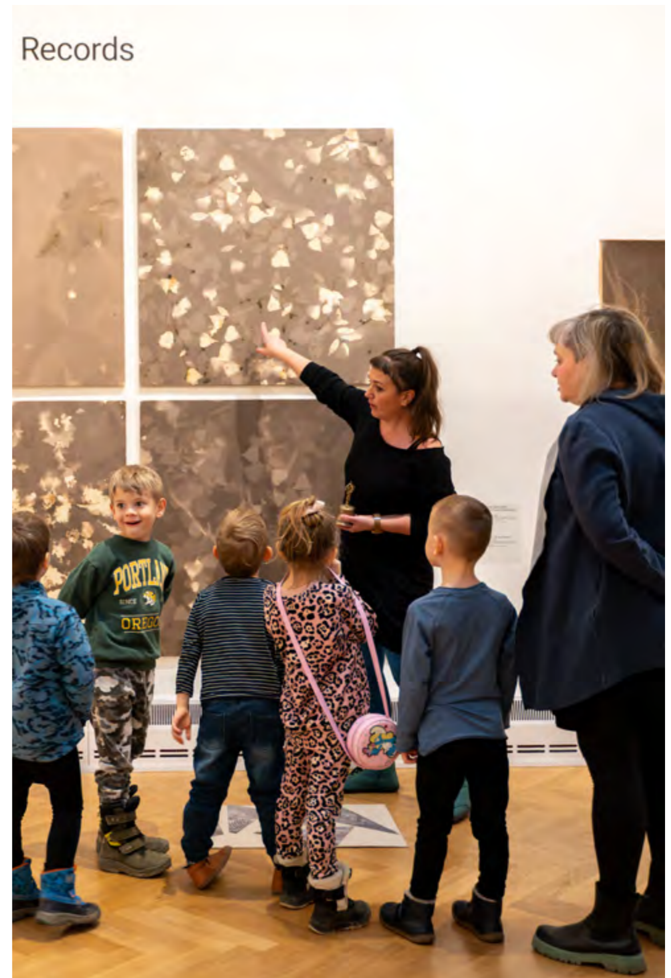
Edukační program k výstavě JIŘÍ ŠIGUT / Minulé a budoucí přítomnosti