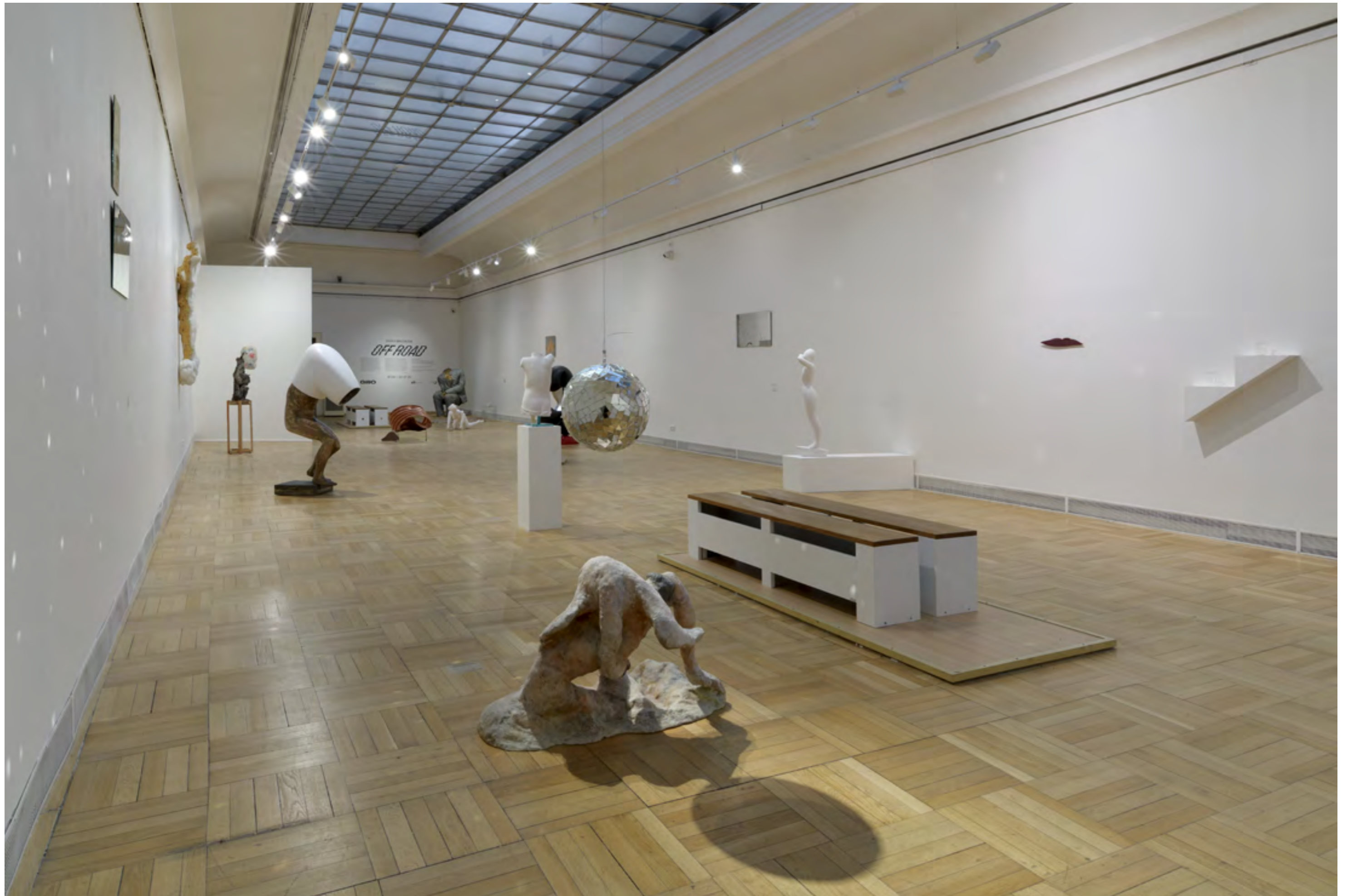
Z výstavy ŠÁRKA MIKESKOVÁ / Off Road