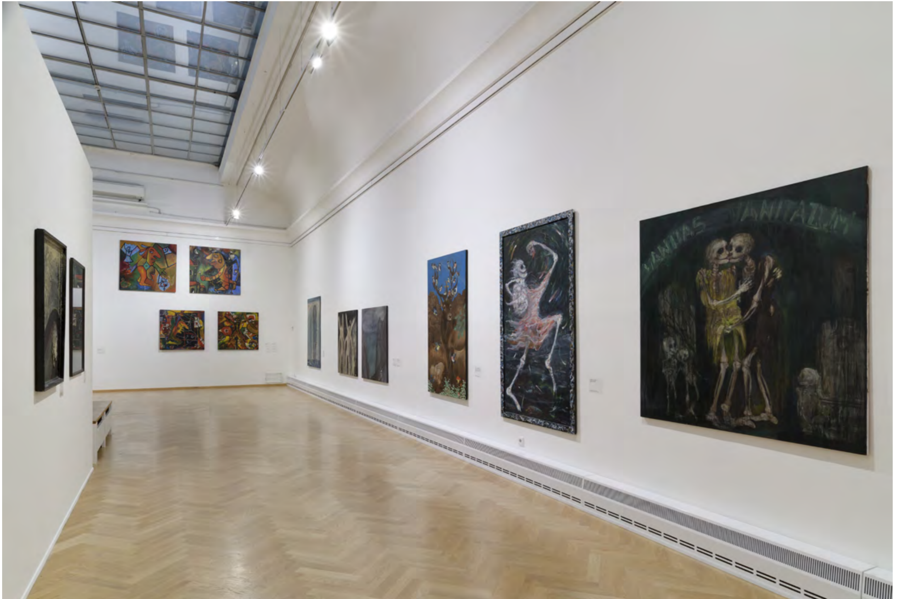
Z výstavy ZDENĚK JANOŠEC BENDA / Pavilon (ne)klídu, foto: Roman Polášek