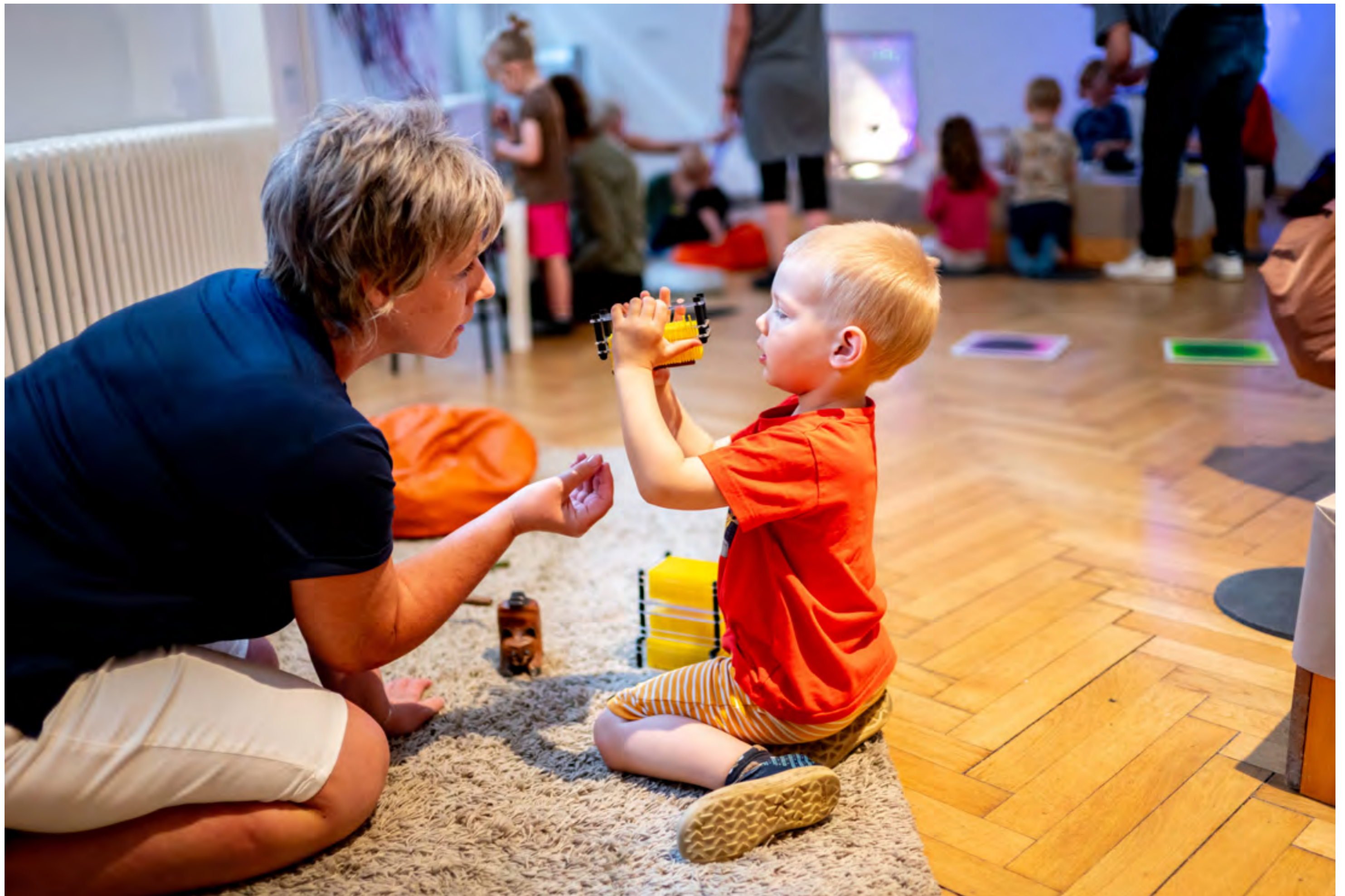
GVUO pro nejmenší