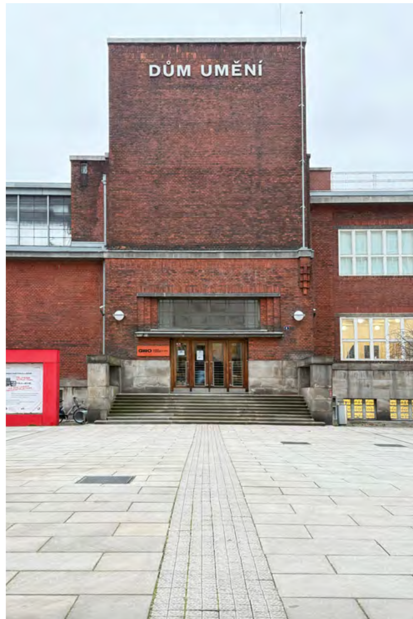
Dům umění, foto: Magdaléna Staňková

info@gvuo.cz gvuo.cz facebook.com/gvuostrava/ instagram.com/dum_umeni_gvuo x.com/gvuo_dum_umeni youtube.com/@gvuo