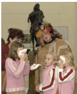
Z průběhu Muzejní noci 2006.

Přehled mimovýstavních akcí je součástí přílohy č. 1