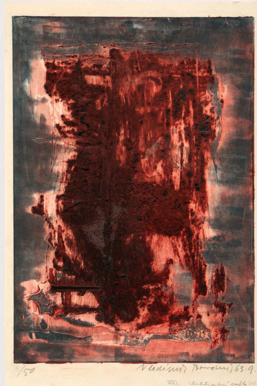
Vladimír Boudník / Strukturální grafika XXI, 1963, GVUO