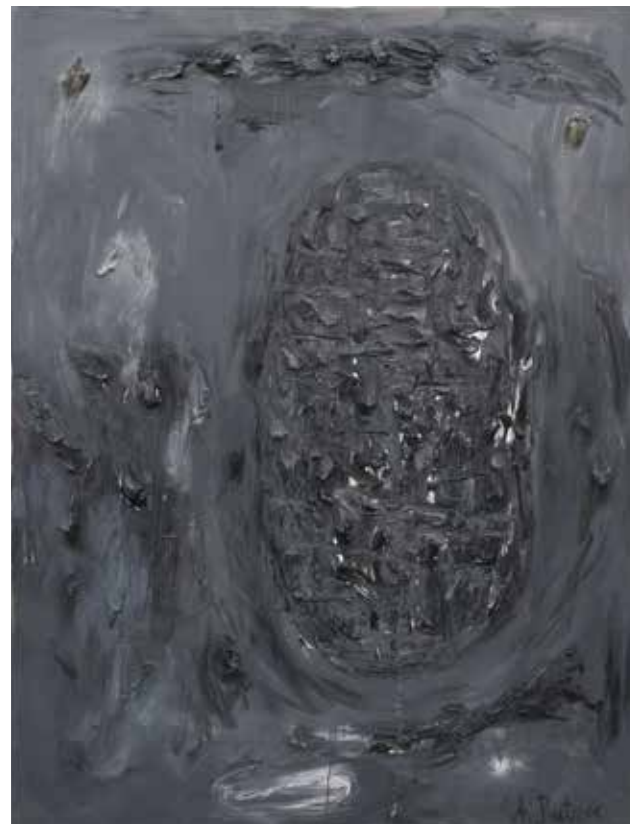
André Butzer Bez názvu / Untitled, 2004 olej, plátno / oil, canvas, 340 × 260 cm, Adam Gallery

The patrons of the exhibition are Christoph Israng, Ambassador of the Federal Republic of Germany, Lukáš Curylo, Deputy Governor of the Moravian-Silesian Region, and Zbyněk Pražák, Deputy Mayor of Ostrava. The project is financially supported by the City of Ostrava.