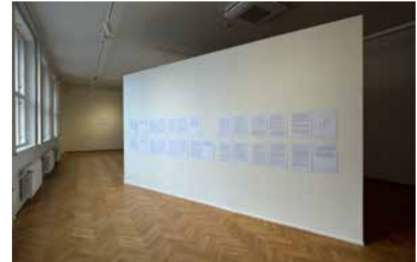
Náhledy do výstavy ZISKY 2018 GVUO / Preview the exhibition ACQUISITION 2018 (KON)TEXTY Jána Mančušky / (CON)TEXTS of Ján Mančuška

The patron of the exhibition is Lukáš Curylo, Deputy Governor of the Moravian-Silesian Region.