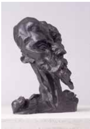
Otto Gutfreund Don Quijote 1911, bronz / bronze, v. 38 cm / height 38 cm