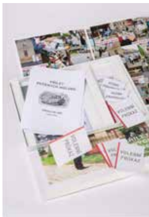
Kateřina Šedá Bedřichovice nad Temží, 2011–2016

RUDOLF SIKORA 16. 10. 2019 – 12. 1. 2020