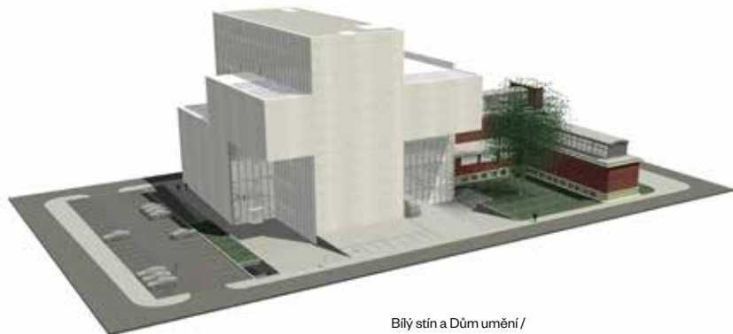
Bílý stín a Dům umění / The White Shadow and the House of Art