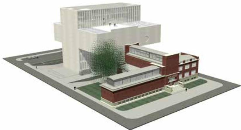
Bílý stín a Dům umění / The White Shadow and the House of Art

respecting the House of Art's rich history (shadow) and looking forward to its bright future (white)