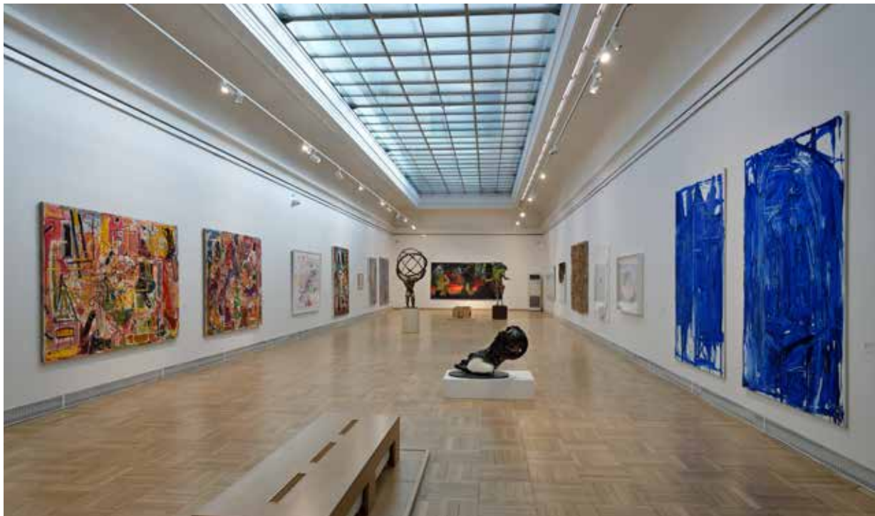
Náhled do výstavy DESET / Preview the exhibition TEN současné německé umění ze sbírky Adam Gallery / contemporary German art from the collection of the Adam Gallery