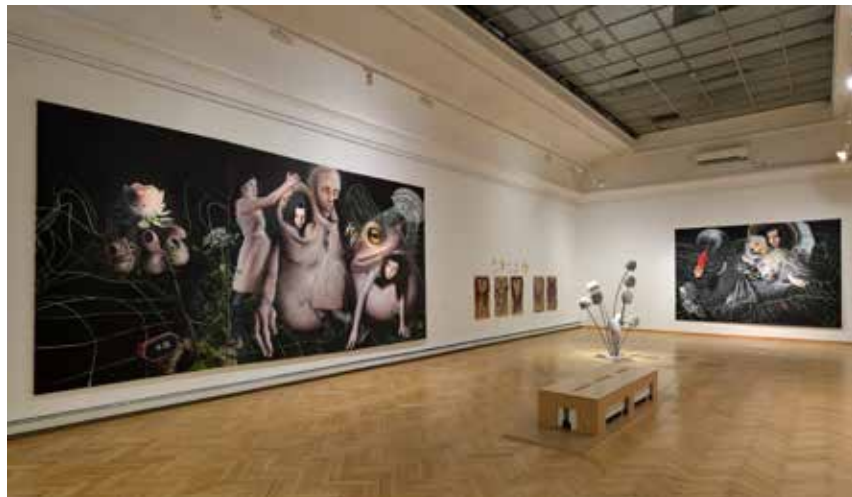
Náhled do výstavy DESET / Preview the exhibition TEN současné německé umění ze sbírky Adam Gallery / contemporary German art from the collection of the Adam Gallery