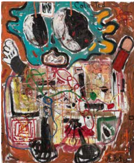
André Butzer Cola-Tod N, 2007 olej, plátno / oil, canvas, 230 × 190 cm, Adam Gallery

současné německé umění ze sbírky Adam Gallery